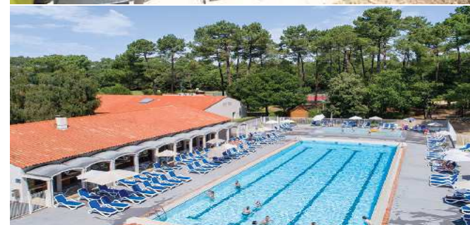
Tarifs par personne et par semaine en chambre double 15 juin au 21 septembre