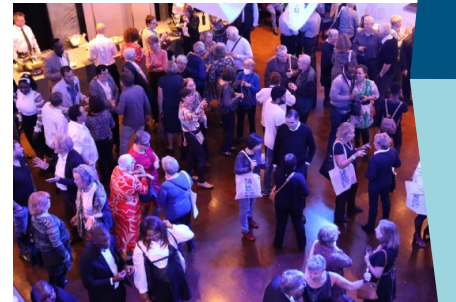
Les animations de la soirée des 50 ans