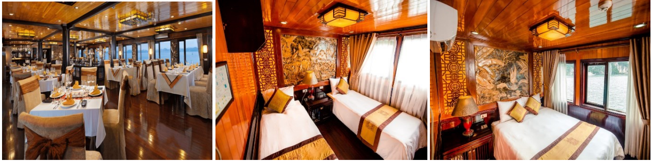
NINH BINH - HOANG SON PEACE 3* SUP - https://hoangsonpeacehotel.com.vn