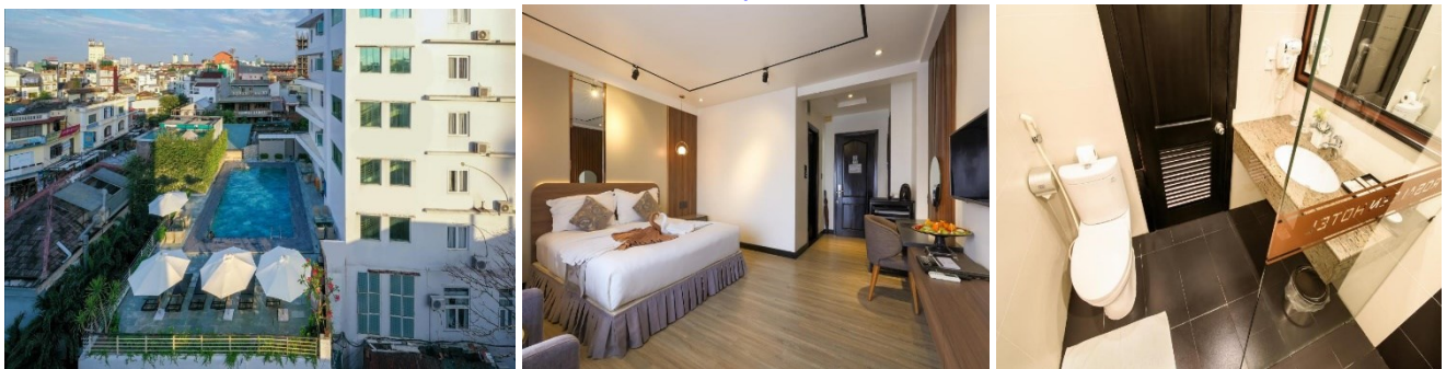
ROSALEEN HOTEL http://www.rosaleenhotel.com