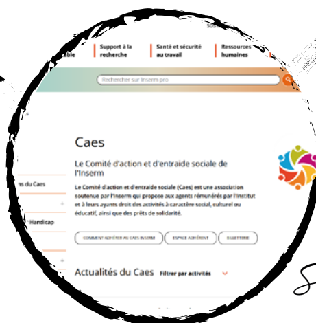
Site du Caes Inserm