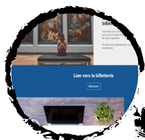
Billetterie en ligne