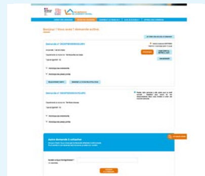
Écran d'un compte personnel avec le suivi de mes demandes